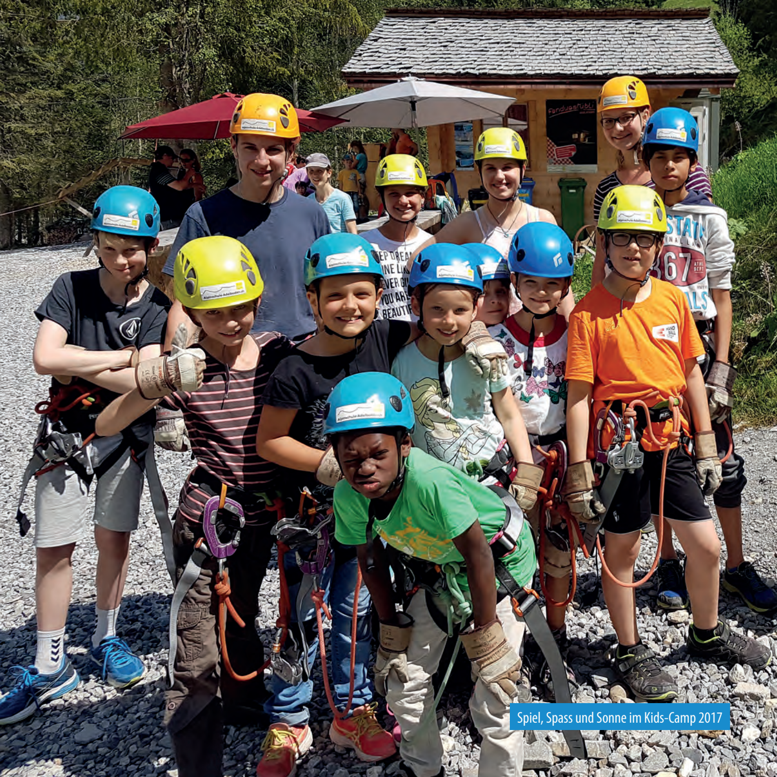
Spiel, Spass und Sonne im Kids-Camp 2017