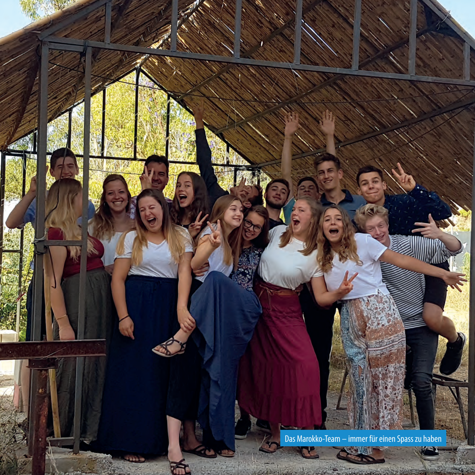
Das Marokko-Team – immer für einen Spass zu haben