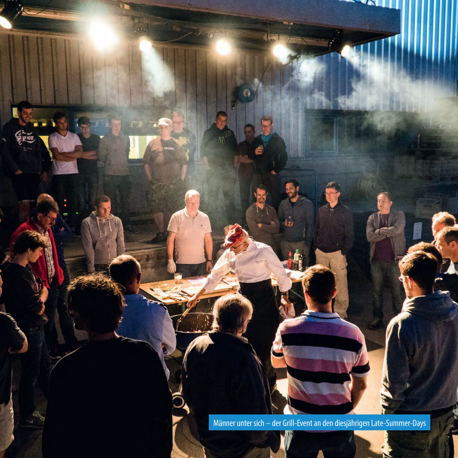
Männer unter sich – der Grill-Event an den diesjährigen Late-Summer-Days