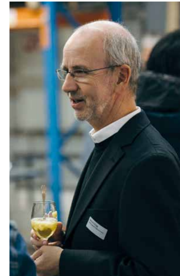
2009 – Im aufmerksamen Gespräch beim Apéro zum 10-jährigen Jubiläum der Stiftung Südkurve